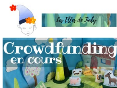
Les Elfes de Tialy font leur