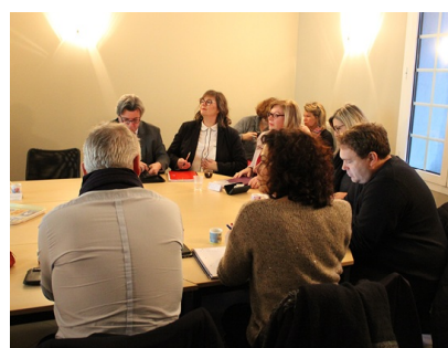
Le comité de sélection du